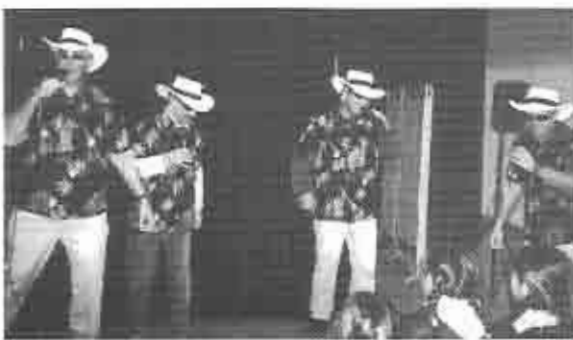
Canción de los turistas