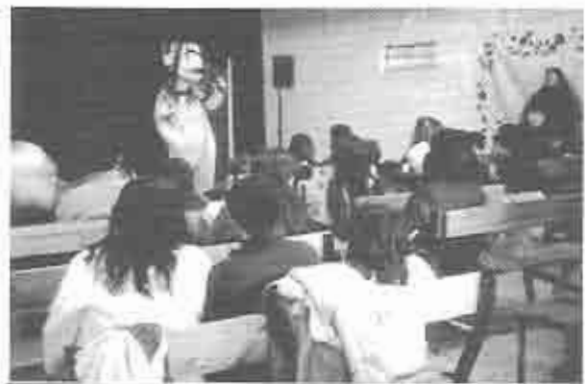
Payaso y concurrencia.