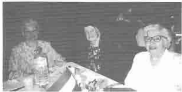
Residentes del Hogar presentes en la Fiesta