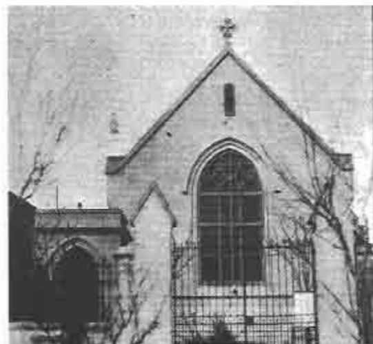
Iglesia de Bahía Blanca